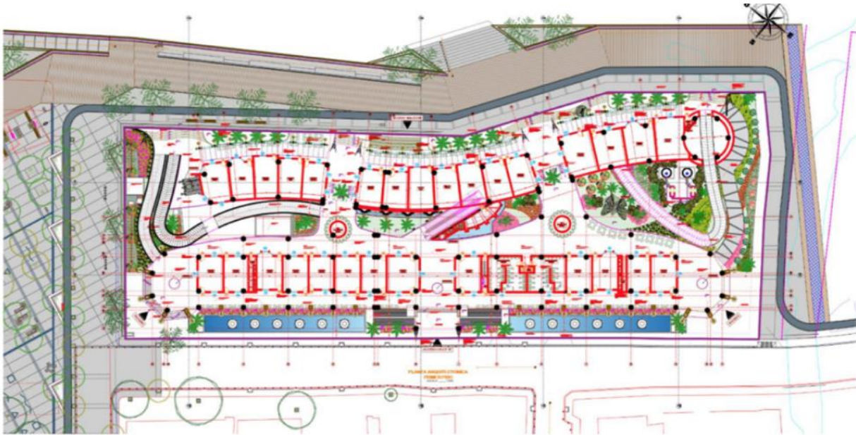
Ilustración 1: Planta Arquitectónica Primer Piso

importancia que tuvo al ser el principal puerto para la entrada de personas de todo el mundo a nuestro país. El proyecto más allá de satisfacer los requerimientos comerciales busca aportar un nuevo hito arquitectónico que como espacio urbano sea detonante y permita el desarrollo de nuevas actividades para los habitantes del municipio y sus visitantes, un nuevo lugar de encuentro con infinitas posibilidades de entretenimiento donde se trata de redescubrir el estilo de vida porteño y elevarlo a un nuevo nivel de plenitud por medio del OBJETO ARQUITECTONICO. Dicha intervención urbanística y arquitectónica en Puerto Colombia Atlántico apunta avivar el progreso comercial y el turismo a gran escala del municipio, que contara con 6787,30 m2 de construcción.