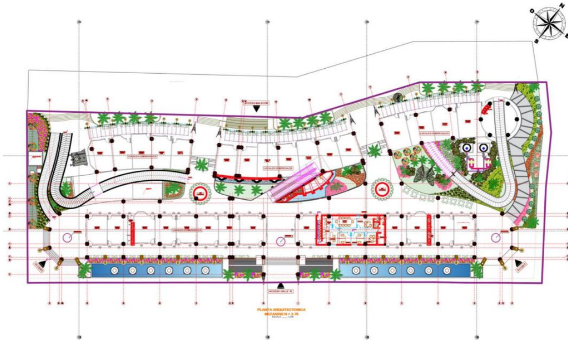
Ilustración 3: Planta Arquitectónica Mezanini

Zona Administrativa La zona administrativa del proyecto distribuida en dos secciones, una de oficinas administrativas y otra de control al usuario