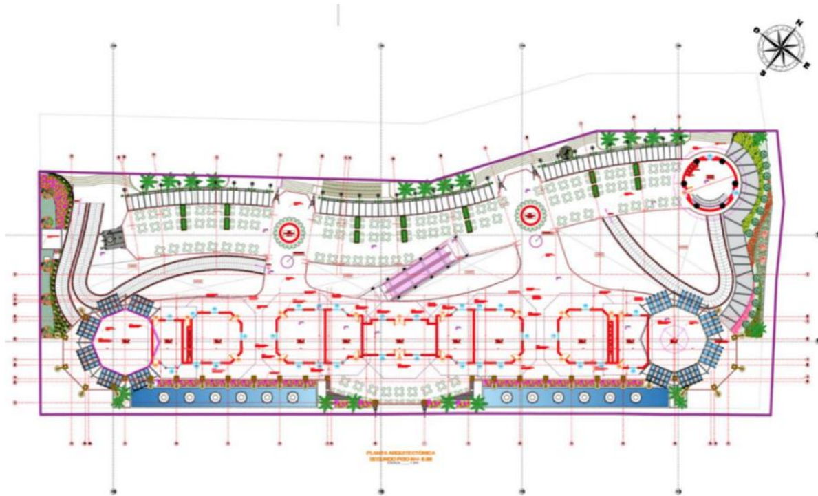
Ilustración 2: Planta Arquitectónica Segundo Piso

Circulaciones Una las consideraciones más relevantes en el proyecto de diseño, Para este proyecto se contempla un eje vertical y horizontales que atraviesen el centro Turístico Gastronómico Internacional. Dentro del proyecto las circulaciones peatonales se plantean predominantemente de formas ortogonales y curvas, pues el orden hace que las circulaciones sean lo suficientemente específicas, sin que sean importantes. Estas influyen directamente en la distribución y definición de la forma en cómo se conectan los espacios, que, aunque cada uno tenga un propósito funcional diferente se deben integrar adecuadamente. Además, estas circulaciones se encuentran cubiertas por elementos porosos que permite la transparencia entre espacios.