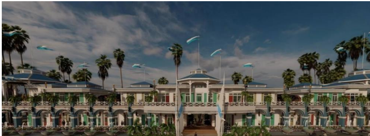
Ilustración 6: Render fachada principal

La zona de locales comerciales se encuentra distribuidas en 3 naves paralelas con vistas hacia la plaza, el muelle, el mar y la zona de manglares.