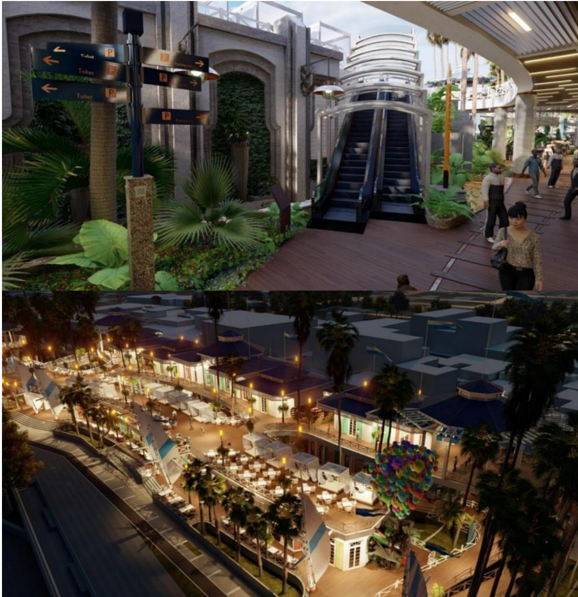
Ilustración 7: Espacios Internos Render