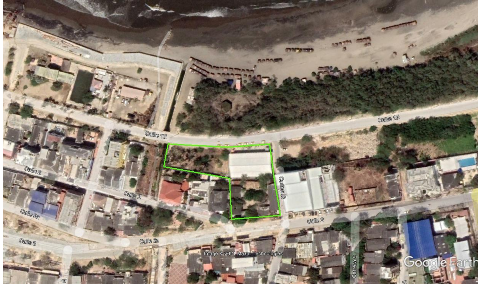
Ilustración 1 Imagen de Localización General Mercado de la Sazón

El proyecto se desarrolla en 3 niveles desde la zona del malecón (calle 1) y 2 niveles desde el acceso de la zona plaza de la iglesia. (Calle 2)