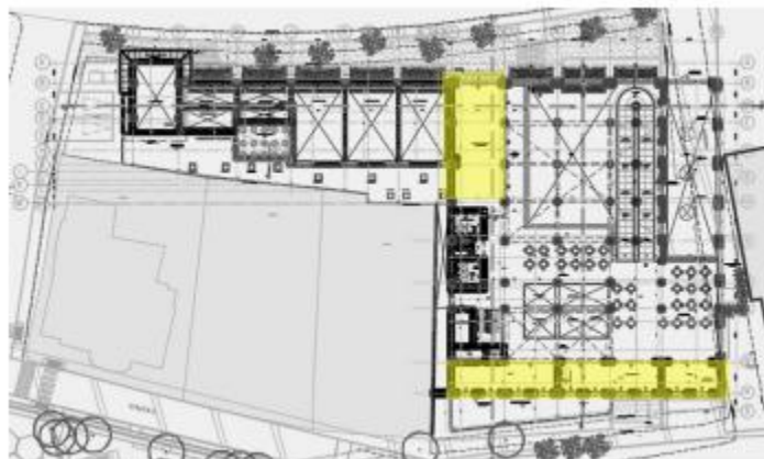
Ilustración 8 - Areas comerciales Tercer Nivel (Diseños Proyecto)