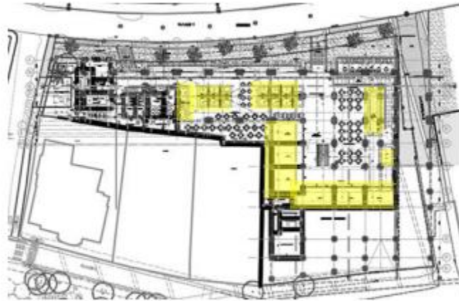
Ilustración 6 - Áreas comerciales Primer Nivel (Diseños Proyecto)