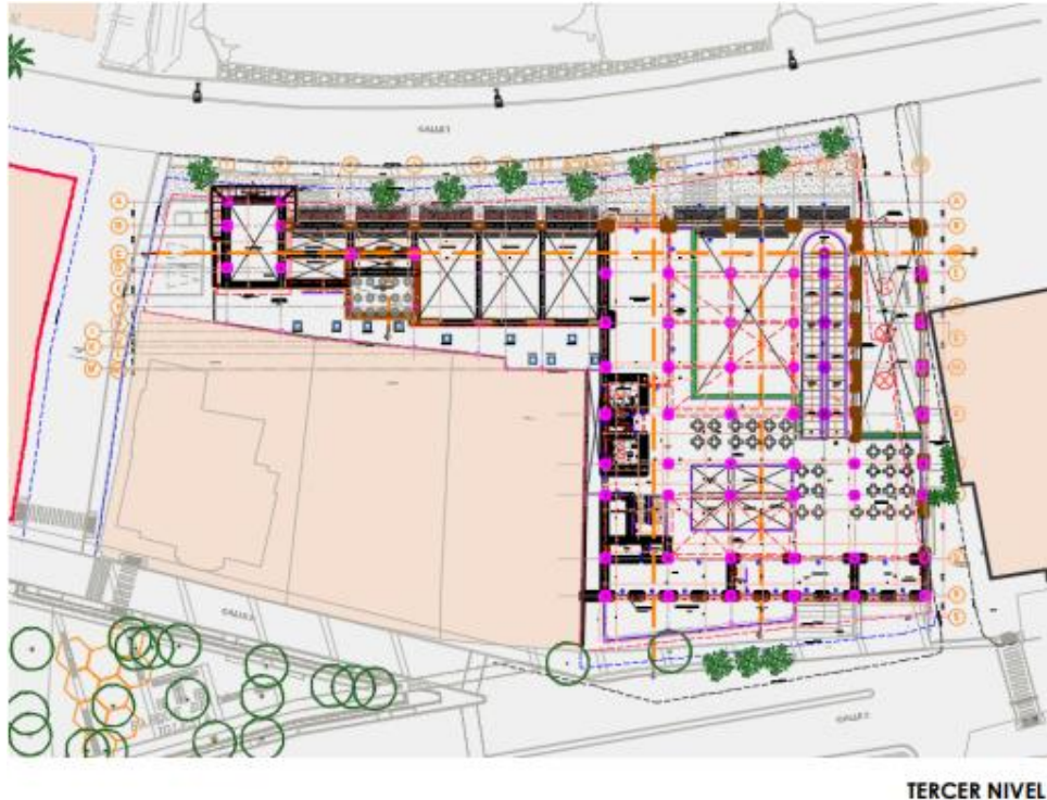
Ilustración 5 -Planta Arquitectónica Tercer Nivel