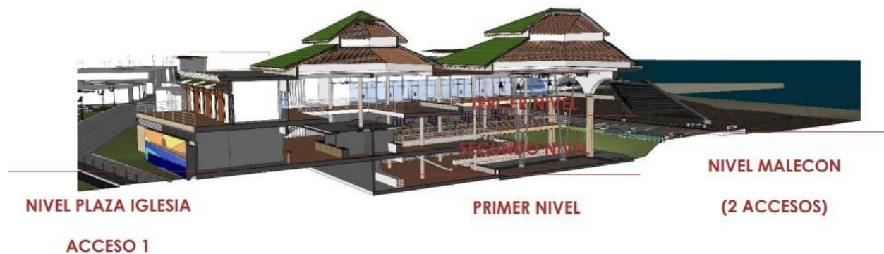
Ilustración 2 Esquemas de Niveles del proyecto (Diseño Proyecto)

El proyecto se desarrolla en 3 niveles desde la zona del malecón (calle 1) y 2 niveles desde el acceso de la zona plaza de la iglesia. (Calle 2)