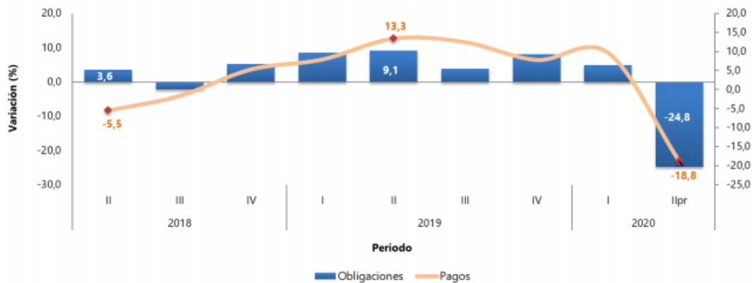
Gráfico 18. Variación anual del IIOC de los pagos y obligaciones en obras civiles (serie empalmada) 2018 (II trimestre) – 2020 Pr (II trimestre)

En el segundo trimestre de 2020 (abril-junio), los pagos efectuados para la construcción de obras civiles registraron un decrecimiento de 18,8%, con relación al segundo trimestre del año anterior. Las obligaciones adquiridas en obras civiles en el segundo trimestre de 2020 registraron una variación de -24,8% frente al mismo trimestre del año 2019. El decrecimiento en los pagos efectuados obedece principalmente al grupo de carreteras, calles, caminos, puentes, carreteras sobre elevadas, túneles y construcción de subterráneos que disminuyeron en un 26,3% sus pagos y restaron 12,2 puntos porcentuales a la variación anual.