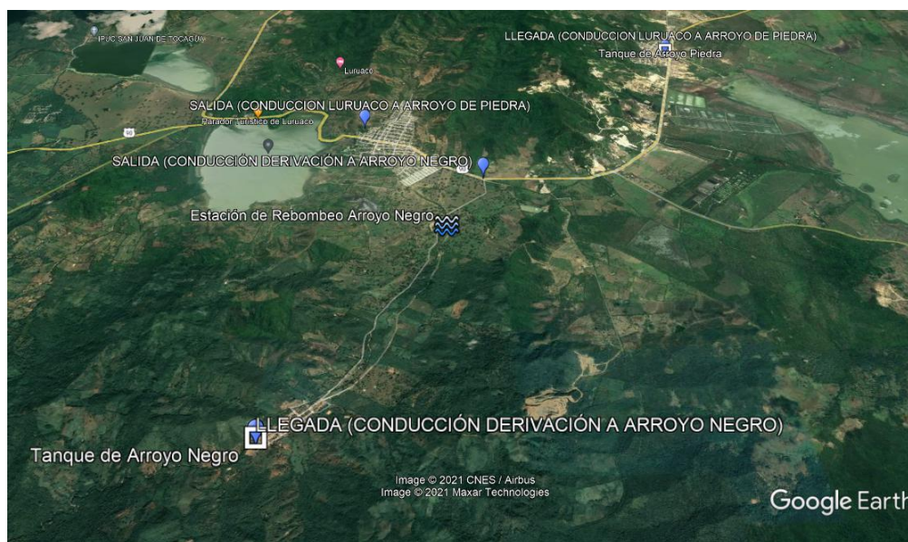
Ilustración 3.

Estas coordenadas son de guía, para mayor exactitud se debe remitir al archivo CAD Georreferenciado del proyecto.