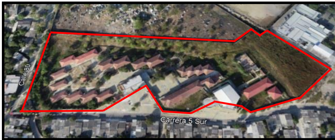
Figura 8 Ubicación IED Santa María

La institución se encuentra ubicada en un lote de aproximadamente 26.580 m 2 , el cual cuenta con nueve (9) bloques de uso administrativo y educativo. Como se puede evidenciar en la siguiente imagen (Figura 9), actualmente, el comedor no cuenta con cubierta. A su vez, la cocina no se encuentra operativa, por lo cual se debe implementar un mejoramiento. Adicionalmente, se planea construir un laboratorio nuevo ya que la institución no cuenta con uno.