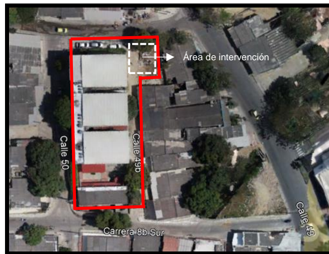
Figura 4 Ubicación IED Comunitaria Metropolitana

La institución se encuentra en un lote de aproximadamente 1000 m 2 , donde actualmente se encuentran cuatro (4) bloques para el uso educativo y administrativo. Como se puede observar en la figura 4, la institución no cuenta con un espacio para la recreación de los estudiantes. Sobre la calle 49b, la institución cuenta con lote de aproximadamente 150 m 2 donde se construirá un aula lúdica. Este nuevo espacio debe contar con: