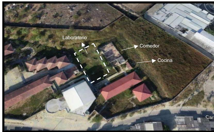
Figura 9 Áreas de intervención IED Santa María

La institución se encuentra ubicada en un lote de aproximadamente 26.580 m 2 , el cual cuenta con nueve (9) bloques de uso administrativo y educativo. Como se puede evidenciar en la siguiente imagen (Figura 9), actualmente, el comedor no cuenta con cubierta. A su vez, la cocina no se encuentra operativa, por lo cual se debe implementar un mejoramiento. Adicionalmente, se planea construir un laboratorio nuevo ya que la institución no cuenta con uno.