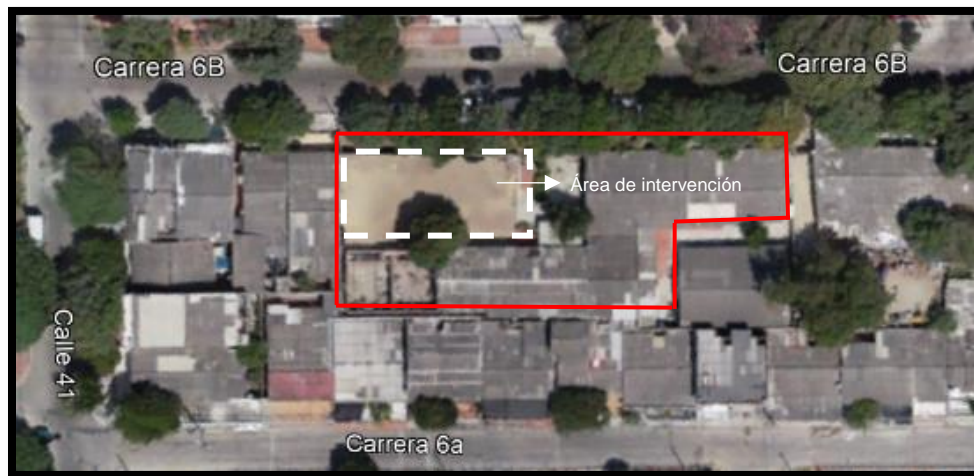
Figura 6 Ubicación IED del Caribe

La institución se encuentra en un lote de aproximadamente 1.230 m2, donde actualmente se encuentran dos (2) bloques para el uso educativo y administrativo. Como se puede observar en la figura 6, la institución cuenta con una cancha de arena que no cumple con las condiciones específicas para el uso deportivo y recreativo de los estudiantes. El proyecto busca construir una cancha multifuncional con cubierta metálica que cumpla con las dimensiones normativas en la NTC 4595 y la cartilla de colegios 10. Adicionalmente, se debe incluir la construcción de graderías y la adaptación de la cancha.