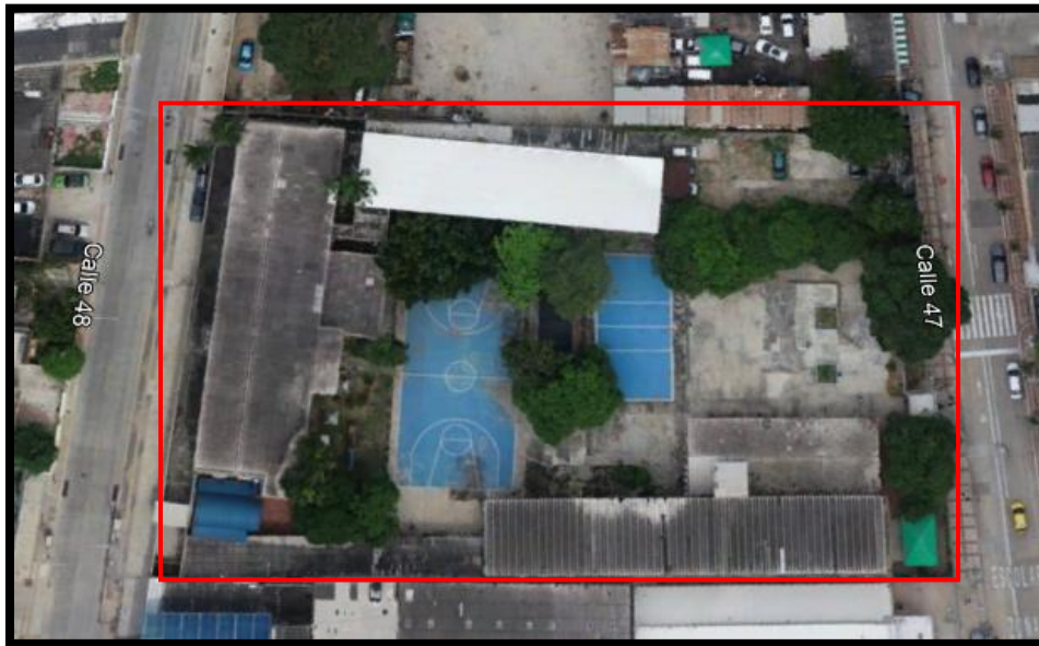
Figura 7 Ubicación IED Mayor de Barranquilla

La institución se encuentra en un lote de aproximadamente 4.890 m 2 , donde actualmente se encuentran cuatro (4) bloques para el uso educativo y un (1) bloque para uso administrativo. Actualmente, la institución presenta fallas estructurales puntuales en cada uno de sus bloques. Por lo cual se hace necesario el reforzamiento y/o rehabilitación de ciertos elementos estructurales. Además, el proyecto plantea el mejoramiento de la infraestructura actual mediante: