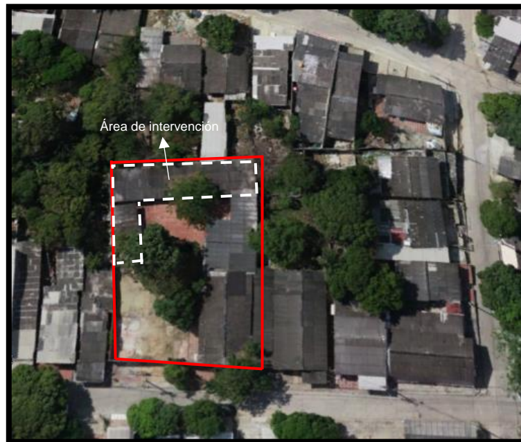
Figura 10 Ubicación IED Jesús de Nazareth - Sede 2

La institución se encuentra en un lote de aproximadamente 880 m 2 , el cual cuenta con dos (2) bloques de los cuales uno (1) se encuentra deshabilitado por alto deterioro de su estructura debido a asentamientos en el suelo. El proyecto contempla la demolición total del bloque 2 y su reconstrucción total. De la siguiente manera: