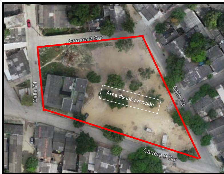
Figura 3 Ubicación IED Comunitaria 7 de abril - Sede 1

La institución se encuentra en un lote de 3.420 m 2 y un área construida de 400 m 2 aproximadamente, donde actualmente se encuentra un (1) bloque de seis (6) aulas. El proyecto consiste en la construcción de dos (2) bloques, como se resume a continuación: