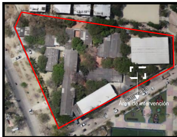
Figura 5 Ubicación IED Ciudadela 20 de Julio

AMPLIACIÓN Y MEJORAMIENTO DE LA INFRAESTRUCTURA EDUCATIVA EN EL DISTRITO DE BARRANQUILLA EDUBAR S.A