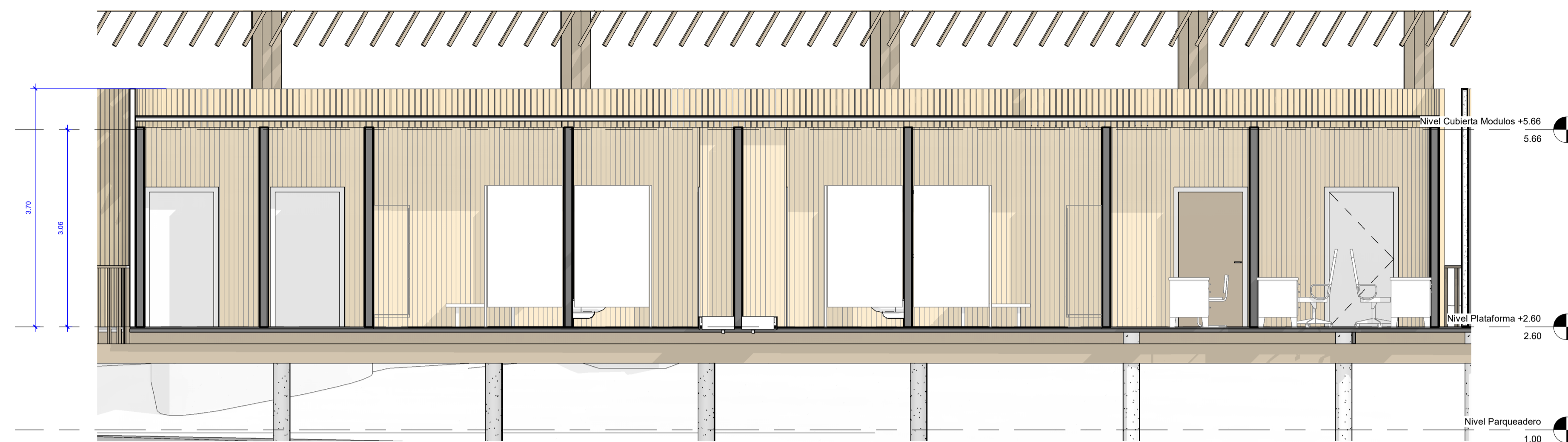
1 Sección 1 Administración Estación III 1 : 50